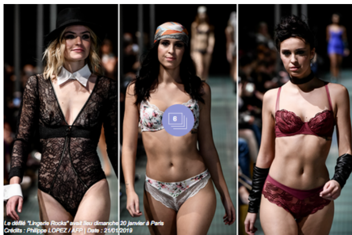
Le défilé "Lingerie Rocks" avait lieu dimanche 20 janvier à ParisDate : 21/01/2019

Un défilé a rendu hommage au savoir-faire et à l'innovation qui aident les femmes "à être bien dans leur peau", ce dimanche 20 janvier, à Paris.